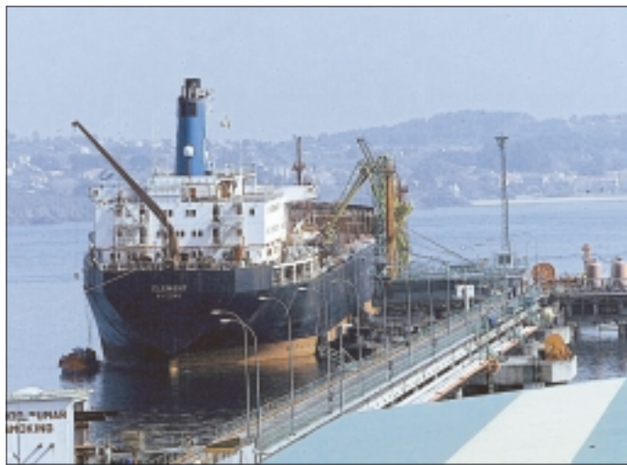
El «Clement» permaneció atracado hasta la tarde de ayer en el pantalán de Repsol Petróleo